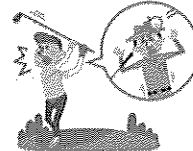
野球・ゴルフなどのボールが当たったケガ