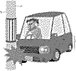
ドライブ中のケガ