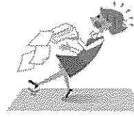
お仕事中、転んでのケガ