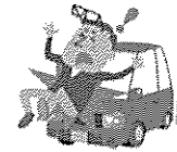
自動車にはねられてのケガ